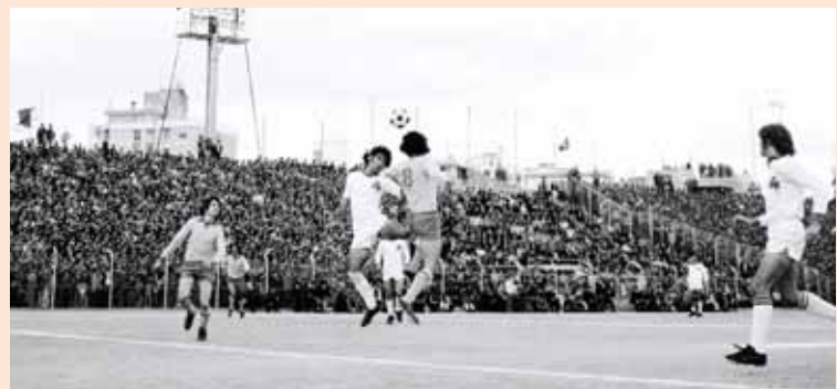
Από τους τελευταίους αγώνες που έδωσαν οι δύο ομάδες της Λευκωσίας στο παλιό ΓΣΠ, 30 Απριλίου 1977.