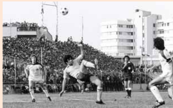
Αγώνας αιώνιων την 1η Φεβρουαρίου 1976, στο παλιό ΓΣΠ.