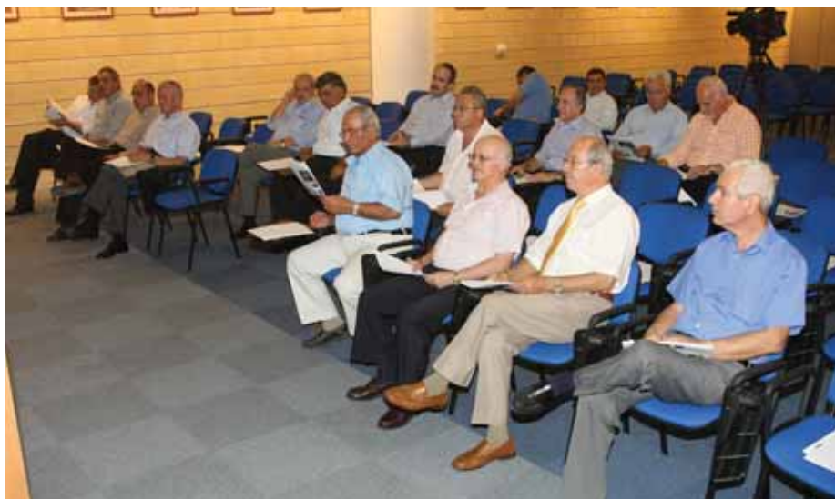
Από τη Γενική Συνέλευση που έγινε στις 16 Οκτωβρίου. Ο πρόεδρος του Συλλόγου ανακοίνωσε, μεταξύ άλλων, ότι πρόκειται να αυξηθούν κατά 5.000 οι θέσεις της ανατολικής κερκίδας του κεντρικού γηπέδου ποδοσφαίρου.

«Οι Σχέσεις του ΓΣΠ με τον ΚΟΑ και την ΚΟΕΑΣ είναι άριστες. Εξάλλου ο στόχος είναι κοινός», τόνισε στη λογοδοσία ο πρόεδρος του ΓΣΠ. Πρόσθεσε ότι «οι προϋπολογισμοί των γυμναστικών συλλόγων καλύπτονται σχεδόν εξολοκλήρου από τον ΚΟΑ» και ότι οι ανάγκες συνεχώς αυξάνονται. Όπως είπε: «Για να γίνει αθλητισμός υψηλού επιπέδου πρέπει να υπάρχουν και μεγαλύτερα κίνητρα. Αυτό πρέπει να το προσέξουν ιδιαίτερα ο ΚΟΑ και η ΚΟΕΑΣ. Οι γυμναστικοί σύλλογοι αποτελούν τη βάση του κλασικού αθλητισμού. Δεν έχουν όμως την οικονομική δυνατότητα για να δώσουν πιο ελκυστικά κίνητρα. Αυτά πρέπει να δοθούν από τον ΚΟΑ, μέσα από μακροχρόνιους σχεδιασμούς, οι οποίοι όμως δεν πρέπει να είναι στατικοί».