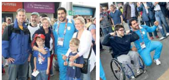
Πολλοί φίλαθλοι ζήτησαν αυτόγραφο αλλά και να φωτογραφηθούν μαζί με τον Απόστολο έξω από το Ολυμπιακό Στάδιο του Λονδίνου!