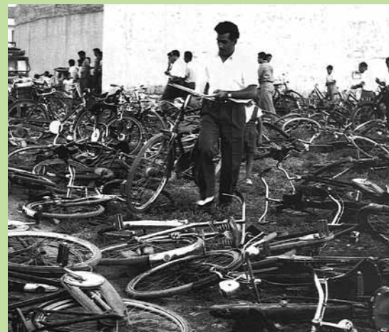
Στιγμιότυπο έξω από το ΓΣΠ, μέσα της δεκαετίας του '60. Εξαγριωμένοι οπαδοί ξέσπασαν πάνω στα σταθμευμένα ποδήλατα σκορπώντας τα έξω από το γήπεδο. Το ποδήλατο ήταν τότε το κύριο μεταφορικό μέσο για τους Λευκωσιώτες.

Δεκάδες νοσταλγικές φωτογραφίες από το παλιό στάδιο ΓΣΠ αλλά και γενικά το κυπριακό ποδόσφαιρο δημοσιεύονται στο βιβλίο «Κυπριακό Ποδόσφαιρο 1900-1960», του δημοσιογράφου-αθλητικού συντάκτη και μέλους του ΓΣΠ Γιώργου Μελετίου. Πολλές από τις φωτογραφίες που δημοσιεύονται στο βιβλίο δεν δημοσιεύθηκαν ποτέ ξανά. Με άδεια του συγγραφέα δημοσιεύουμε σε κάθε τεύχος του ενημερωτικού μας δελτίου κάποιες από αυτές τις φωτογραφίες.