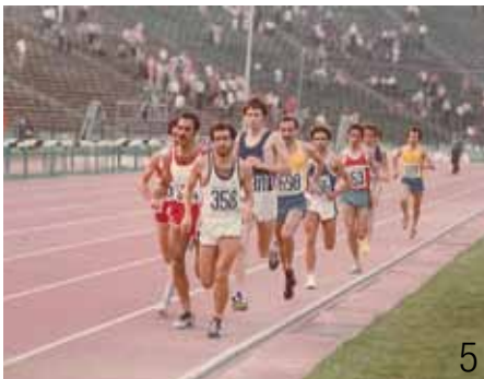
1. Πρωτείο στα 12 χιλιόμετρα, στη Βεργίνα, το 1981. 2. Σημαιοφόρος της Ελλάδας σε Βαλκανικούς, στο Σλίβεν της Βουλγαρίας, το 1981. 3+4. Πρόσφατο οικογενειακό ταξίδι στη Βιέννη, με τη σύζυγό του Γιώτα και τους γιους του Ξενοφώντα και Βίκτωρα. 5. Βαλκανικοί 1982, πρωτείο στα 10.000 μ. στο Βουκουρέστι.