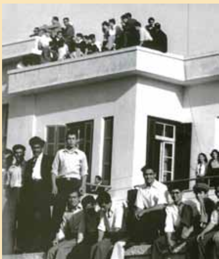
Θεατές στον τοίχο και στα απέναντι από το στάδιο ΓΣΠ κτίρια. Το φαινόμενο αυτό σημειωνόταν σχεδόν σε κάθε αγώνα στο στάδιο της πρωτεύουσας επί πολλές δεκαετίες.

Με άδεια του συγγραφέα δημοσιεύουμε σε κάθε τεύχος του ενημερωτικού μας δελτίου κάποιες από αυτές τις φωτογραφίες.