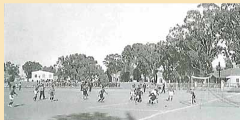
Φιλικός αγώνας Τραστ - Ολυμπιακού Λευκωσίας, το 1931, στο παλιό ΓΣΠ, το οποίο χρησιμοποιούσαν και οι δύο ομάδες για έδρα τους. Ήταν μια από τις πρώτες συναντήσεις των δύο ομάδων, καθώς ο Ολυμπιακός μόλις είχε ιδρυθεί.