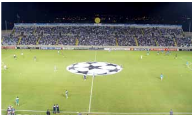
Από τον αγώνα Ανόρθωσης-Παναθηναϊκού.